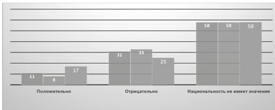
Рис. 3. Распределение ответов респондентов на вопрос: «Как вы относитесь к межнациональным бракам?»

Но при этом лишь пятая часть населения (22 и 23% во Владивостоке и Хабаровске и 16% в Южно-Сахалинске) заявили, что у них нет никаких препятствий для понимания иностранцев и сближения с ними (рис. 2). Две трети опрошенных (61% в Хабаровске, 63% во Владивостоке и 66% в Южно-Сахалинске) закономерно полагают, что такой преградой является незнание языка. Культурно-цивилизационный фактор – «манеры поведения» иностранцев и «различия в культуре» является сдерживающим барьером для каждого пятого жителя во Владивостоке (21-22% респондентов), четвертого (24-28%) в Хабаровске и каждого третьего (30-34%) на Сахалине. При этом разница в уровне образования, а также «личные предубеждения» не являются, по мнению респондентов, обстоятельством, заслуживающим серьезного внимания.