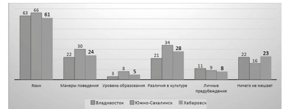
Рис. 2. Распределение ответов респондентов на вопрос: «Что мешает Вашему пониманию иностранцев и сближение с ними?»

Пробным шагом в изучении роли этнокультурного фактора в восприятии дальневосточниками зарубежной миграции стал вопрос: «Ощущаете ли вы дискомфорт при общении с иностранцами?» Как оказалось, у большинства опрошенных (64% во Владивостоке, 71% в Хабаровске и 73% на Сахалине) такой проблемы не существует. В существовании её признались четверть респондентов во Владивостоке и Хабаровске (24 и 25%) и 17% – в Южно-Сахалинске.